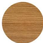
PIN DE MONTAGNE